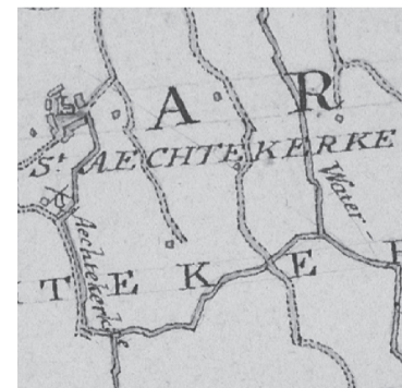
Kaart uit 1750 waarop de schuivtlot duidelijk zichtbaar is.

Na aanleiding van een aantal vragen in verschillende uitgaven van de Agathacourant wat betreft de schuivtlot op Aagtekerke probeer ik wat opheldering te geven over een systeem wat een aantal eeuwen gefunctioneerd heeft. Voor een zo duidelijk mogelijk verhaal is niet alles specifiek voor Aagtekerke, maar het zal hier ook waarschijnlijk zo gebruikt zijn. Allereerst een indruk van de wegen op Walcheren. Voor het gemaal Boreel in gebruik werd genomen te Middelburg was Walcheren, kort door de bocht genomen, een moeras. Walcheren is als het ware een soepbord of hoe je het noemen wil; aan de randen hoog en droog en in het midden, rond Buttinge als diepste punt, laag en nat. In de zomertijd waren de landwegen berijdbaar, vooral bij langdurige droogte, maar in de winter kon je er niet met een wagen doorkomen. Door slechte afwatering en door veelal lage ligging stonden des winters de meeste aarden wegen lange tijd onder water. Men stak dan vaak in de bermen der ondergelopen wegen stokken als bakens om de goede richting aan te geven. Op Walcheren met zijn kromme wegen was dat wel nodig. Om de wegen op voldoende hoogte te houden werd in 1680 door de Staten van Zeeland verordeneerd dat "alle spijsje komende uyt de slooten en dulven op de wegen souden moeten worden geworpen". De toestand verbeterde niet veel.