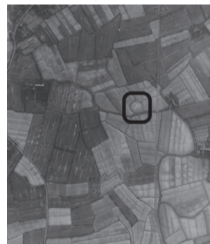
Foto RAF 1946 waarop de berg nog zichtbaar is.